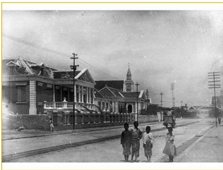
Afb. 5: Pietermaaiweg 4, begin 20e eeuw

Op een foto (afb. 4) die vòòr 1877 kan worden gedateerd is het huidige monument Pietermaaiweg 4 duidelijk te herkennen. 18 Dit betekent dat het nieuwe herenhuis van Mordechay Henriquez niet is verwoest tijdens de Grote Orkaan van 1877, die vooral op Pietermaai een ravage had aangericht. De hoge en zware onderbouw zal zeker de nodige bescherming hebben geboden. Het woonhuis op de foto heeft een opvallend groot, blokvormig bouwvolume op een hoge onderbouw en een ruim portiek met trappartijen. Op de foto staan tegen de westelijke erfscheiding bijgebouwen met een grote poort. Dit waren zeer waarschijnlijk een paardenstal en een koetshuis. 19 Verder is op deze foto en op foto's uit de eerste helft van de 20e eeuw te zien dat het dak was voorzien van dakkapellen. Voor het huis stond een erfscheiding bestaande uit kolommen en hekwerk met spijlen (afb. 5).