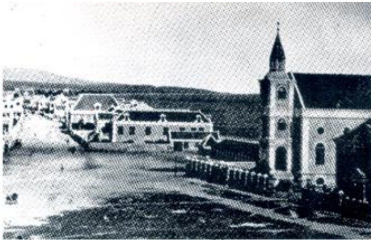
Afb. 4: Pietermaai, Pietermaaiweg 4 links van Tempel Emanu-El (vòòr 1877)