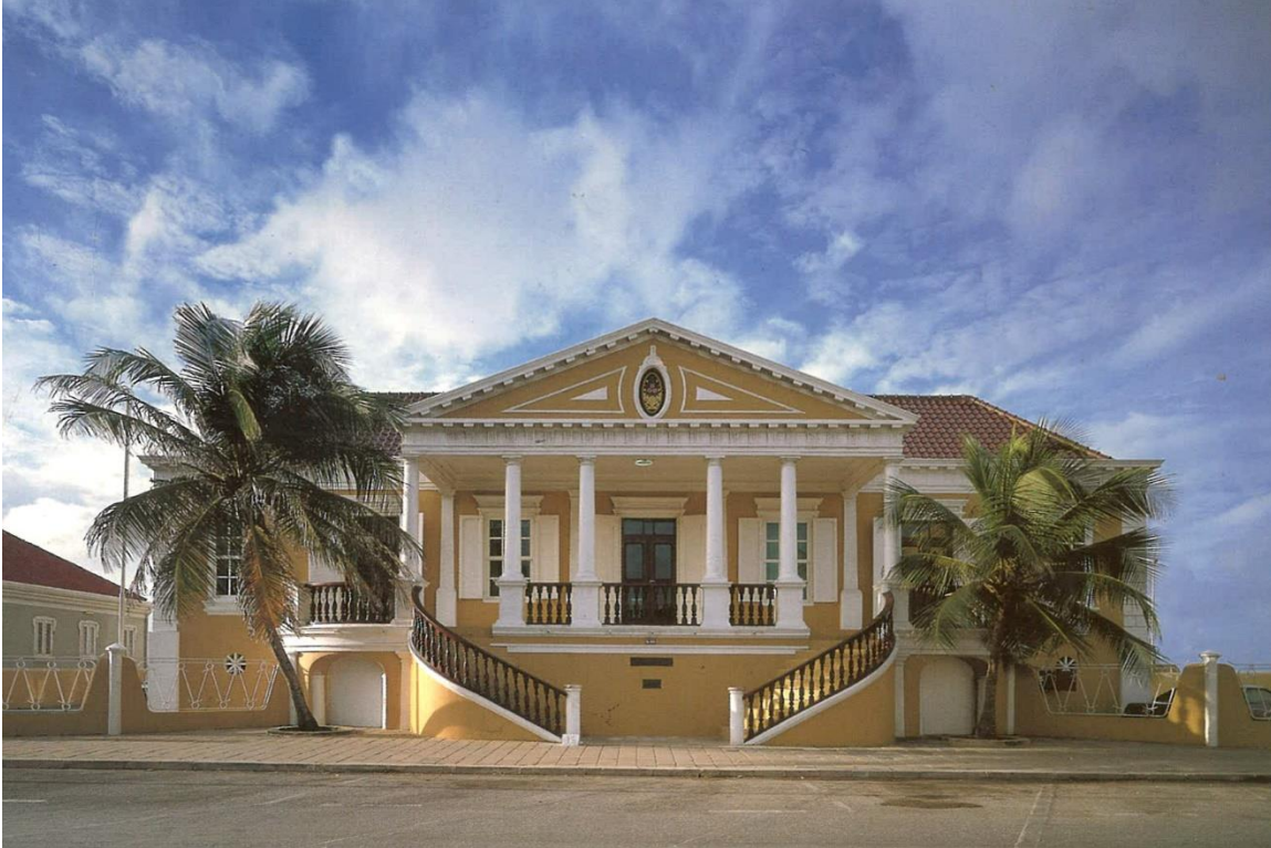
Pietermaaiweg 4